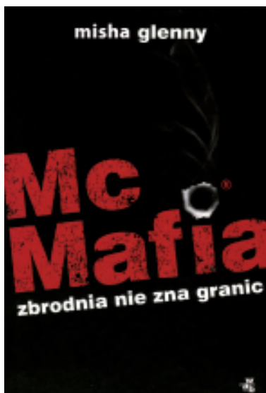
Misha Glenny, „McMafia, zbrodnia nie zna granic”, Wydawnictwo WAB 2009

W obliczu sportretowanych w świetnej książce Mishy Glenny'ego potężnych siatek przestępców, często powiązanych z politykami, goniących za zyskiem, oplatających Japonię, Brazylię, Kolumbię, Nigerię, RPA, Bałkany, Indie, Chiny, Afganistan, Zjednoczone Emiraty Arabskie i Koreę Północną, międzynarodowy terroryzm jest mało znaczącym, choć medialnie spektakularnym zjawiskiem. Prawdziwe zagrożenie dla pokoju i stabilności świata czai się gdzie indziej – jest nią ludzka żądza zarobienia jeszcze większych pieniędzy. Narkotyki, prostytucja, cyberprzestępstwa, salony hazardu, przemyt ludzi, fałszerstwa pieniędzy i produktów, eksploatacja rzadkich minerałów w Afryce, nielegalne połowy jesiotrów w Rosji, szmugiel broni – na wszystkim można zarobić, a zyski szara strefa świetnie inwestuje. Albo wypierze w rajach podatkowych, albo wprowadzi do obrotu w podziemiu. Interesy w tej branży niewiarygodnie się przenikają, a największe sukcesy odnoszą ci, którzy – jak menedżerowie globalnych korporacji – potrafią zarządzać podległymi aktywami. Coraz częściej z takim obliczem świata mają i będą mieć do czynienia żołnierze. (AG)